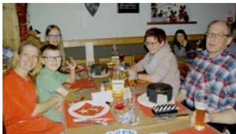
Vor dem großen Silvestermenü