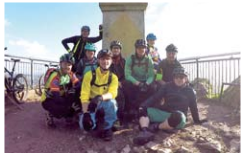
Die MTB-Kurs-Teilnehmer auf dem Litermont