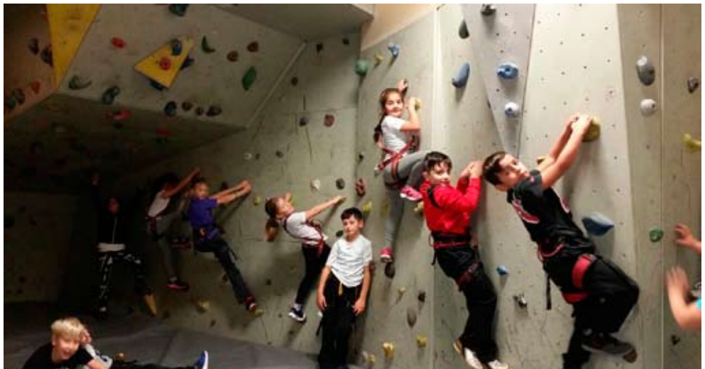
Das bouldernde Klassenzimmer