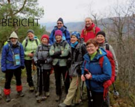
Die Wandergruppe auf dem Ehrberg